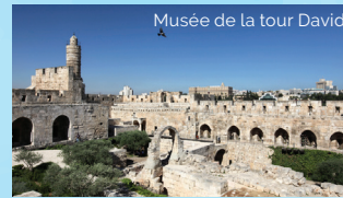
Musée de la tour David