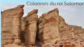
Colonnes du roi Salomon