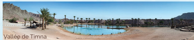
Vallée de Timna